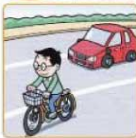
白線1本、白線1本と点線は通行できます。

歩道のない道路で、歩行者や自転車の通行のための路端寄りの道路標示によって区画された部分