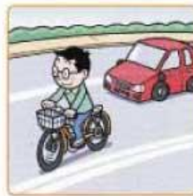
白線2本は歩行者用路側帯ですので、通行できません。